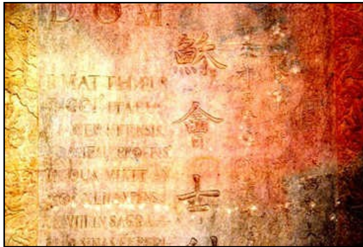
Grafsteen van Matteo Ricci in Peking

In 2007, ter gelegenheid van een colloquium in Macareta, had Benedictus XVI al benadrukt dat P. Ricci een “voorbode” was geweest van de vriendschapsband tussen China en het christendom.