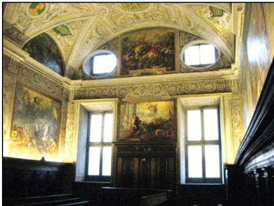
Eerste kapel van de Mariacongregatie, Rome

Van bij het begin van de Sociëteit is er sprake van Mariaverering. In het leven van Ignatius van Loyola nam zij een belangrijke plaats in. Ook in de Geestelijke Oefeningen komt zij regelmatig ter sprake bij meditaties.