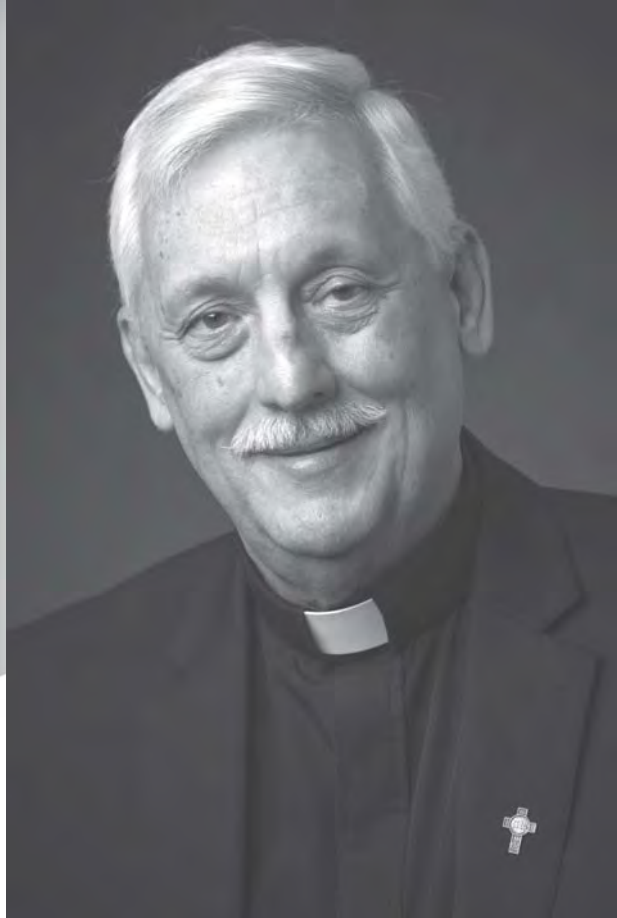
Pater Arturo Sosa, SJ 31st Algemene Overste van de Sociëteit van Jezus