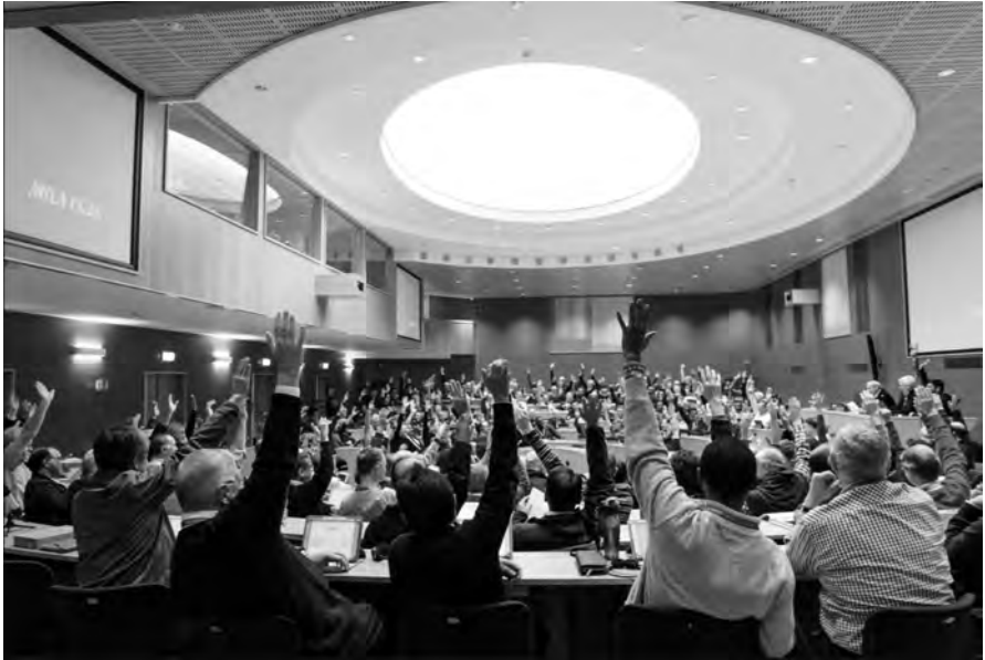
Slotsessie AC36, 12 november 2016