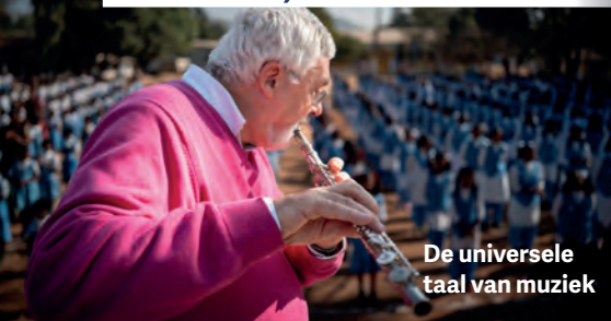
De universele taal van muziek