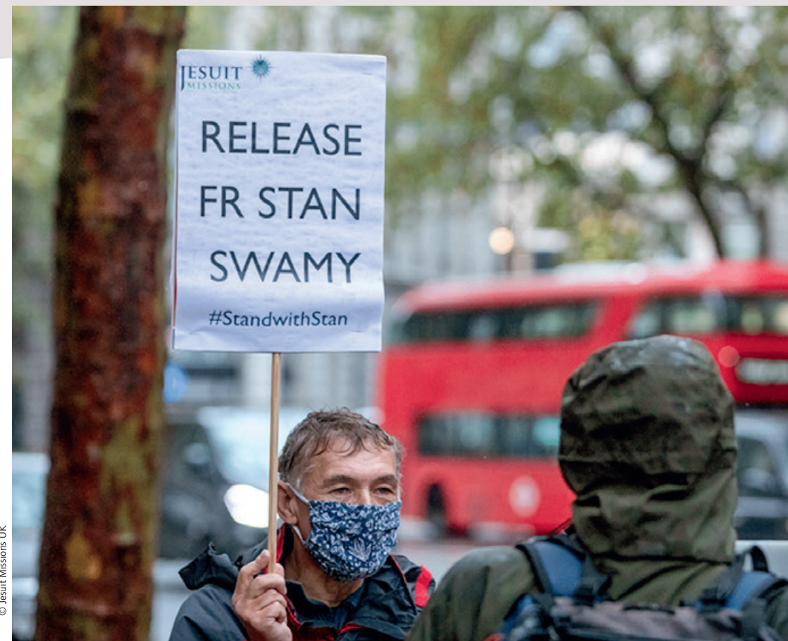
Protestactie voor de Indiase ambassade in Londen.

De arrestatie van Father Stan heeft miljoenen mensen bewust gemaakt van de harde realiteit van wreedheden door de staat tegen 'verdedigers van de mensenrechten' in India. Het heeft weldenkende personen verenigd om samen te vechten tegen de onrechtvaardige 'Unlawful Activities (Prevention) Act', die onder het mom van 'nationalisme' de fundamentele mensenrechten van de burgers niet respecteert. Iedereen die tegen de huidige regering of haar beleid spreekt, wordt gebrandmerkt als 'antinationaal' en 'terroristisch' en zonder proces in de gevangenis gezet. In de afgelopen drie jaar zijn ongeveer 4.000 mensen gearresteerd op grond van deze draconische maatregel en ze rotten weg in de gevangenis.