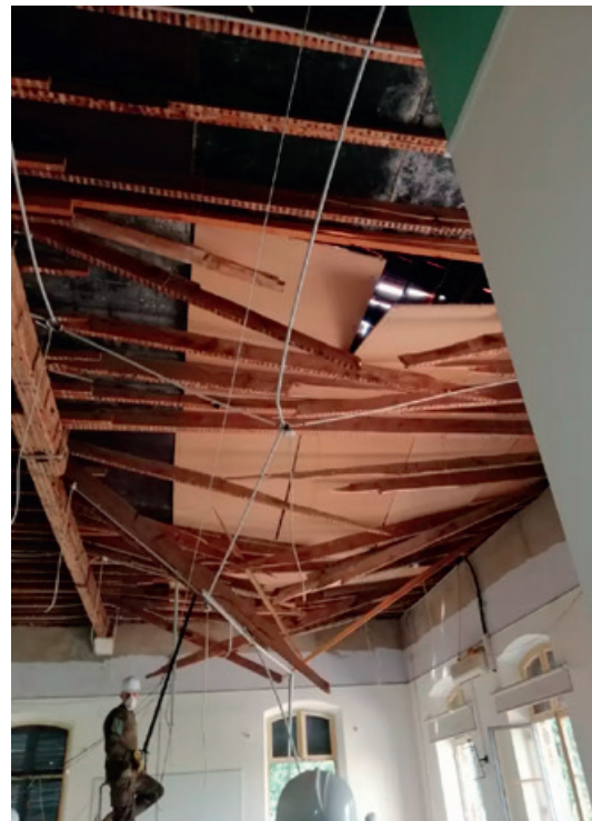
Het beschadigde interieur van de Sint-Jozefkerk - Beiroet

En dan op 4 augustus, 18.07 uur, de dubbele ontploffing van het ammoniumnitraat. Het was als een aardbeving en een ontploffing tegelijk. Het land