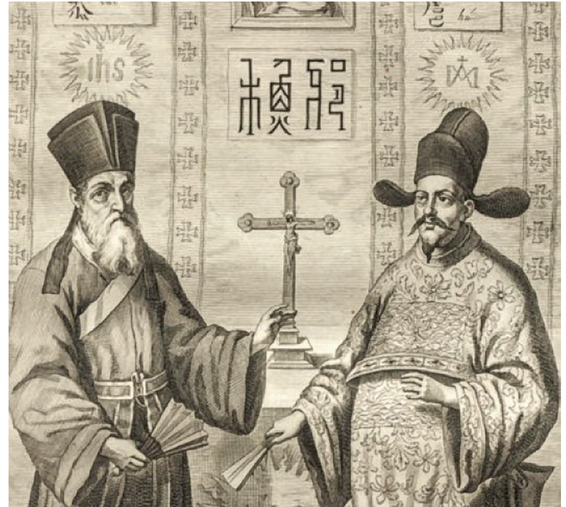
Matteo Ricci met de wiskundige Xu Guangqi.