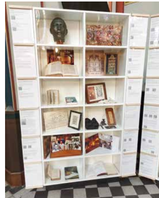
Een kast van de reizende expositie langs jezuïetenhuizen in de Lage Landen.