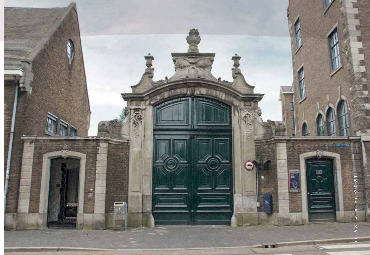
Canisianum aan de Tongersestraat 53 in Maastricht