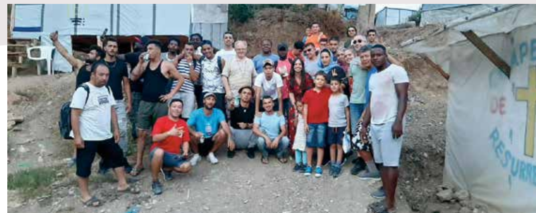
Kameroen, Congo, Afghanistan, Syrië, Iran, Irak, Togo, Frankrijk

Vanaf het ogenblik dat mensen antwoord krijgen op hun asielaanvraag – om het even of die nu wordt ingewilligd of afgewezen – wordt de schamele toelage van vijftien euro per maand stopgezet. Samos telt honderden, en Athene duizenden vluch-