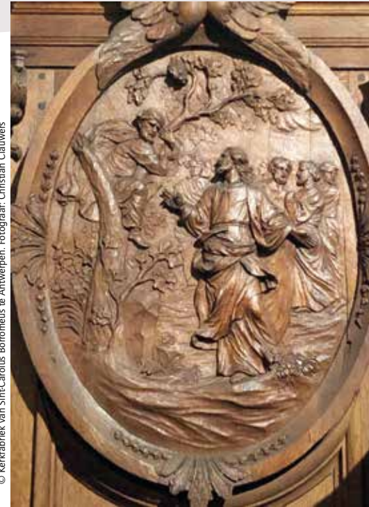
Jezus ziet Zacheus zitten in een boom en roept hem.