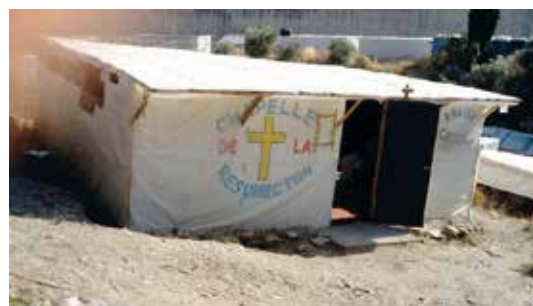
De nieuwe kerk op Samos

De euforie duurde niet lang. Op het eiland Samos worden de krotten en tenten, die met de beschikbare middelen zijn gebouwd, omringd door muizen, ratten en soms slangen. Asielzoekers worden opeengepakt in het onhygiënische kamp. Op de dag dat een groot deel van het terrein in oktober 2020 afbrandde, begonnen de mensen met veel enthousiasme en solidariteit hun behuizingen weer op te bouwen. En toen kort daarna de aarde beefde en de katholieke kerk van de stad niet meer toegankelijk was, hebben de Afrikanen in het kamp een prachtige kleine kerk gebouwd die plaats biedt aan zestig mensen. Covid of niet, de kerk is vol: mensen zingen, dansen en loven de Heer. Ik ben getuige van een geloof, een toewijding en een deelname die men in het Europa van vandaag nog maar zelden aantreft.