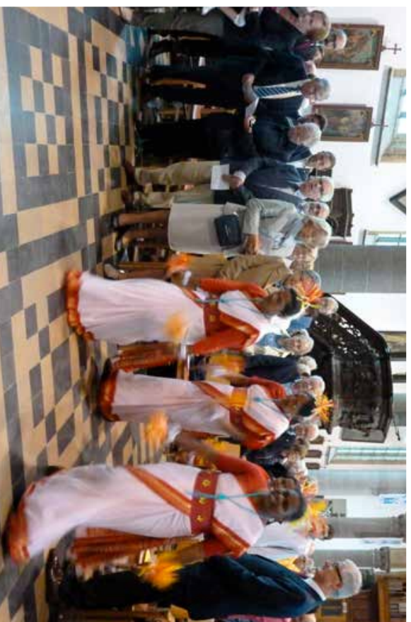
De zusters Ursulinen van Tildonk