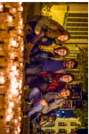
Het jaarlijkse 'light a candle' event https://www.kuleuven.be/ur/activiteiten/rouw/lightacandle/en