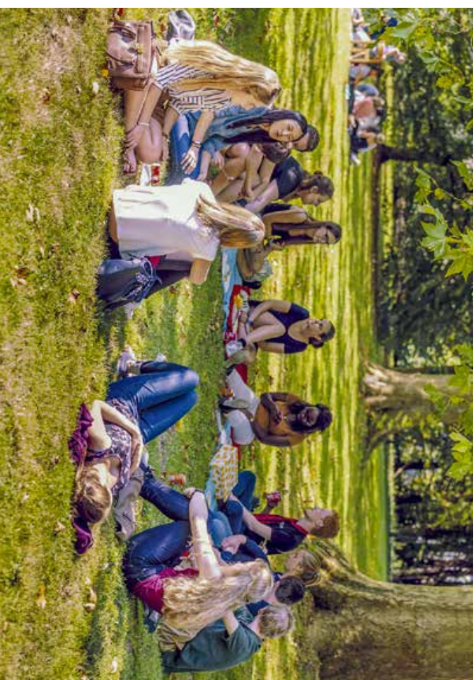
Jaaropening universiteit

De Universitaire Parochie heeft ook veel van een gewone parochie: er wordt gedoopt, getrouwd, begraven, met vieringen in het weekend. Er worden kinderen voorbereid op de eerste communie en op het vormsel. En hoewel de parochie relatief jonge mensen trekt, leeft ook hier de vraag hoe het verder moet, en wat we kunnen doen om tieners en jongeren bij geloof en kerk te betrekken. Sterke punten van de parochie zijn de kindervoordienst, met elke