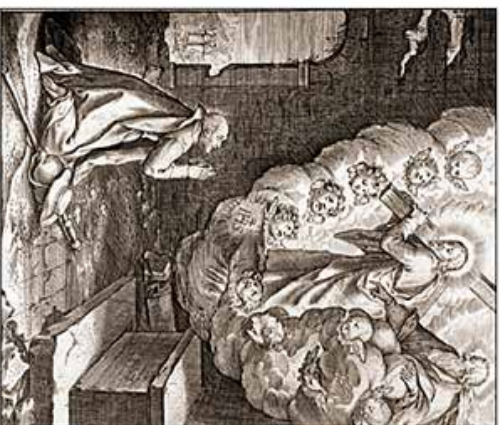
Lucas 5,4: 'Vaar naar het diepe'

De afbeelding geeft Ignatius van Loyola's visioen in La Storta weer. Het IHS-Logo werd geïnspireerd door een exhortatie van paus Franciscus. De paus moedigde de jezuïeten aan om in moeilijke tijden samen met God te 'roeien' in dienst van de Kerk volgens de oproep van Jezus aan zijn leerlingen: 'Vaar naar het diepe' (Lc 5,4).