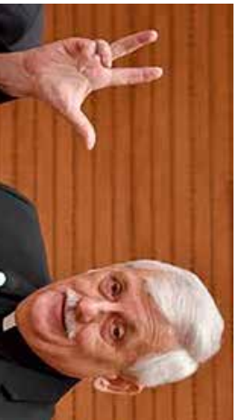
Generaal-overste Arturo Sosa SI

Arturo Sosa Abascal werd de Katholieke Universiteit van Venezuela in 1948 geboren in Caracas, Tachira in Venezuela. Van 1996 tot 2004 was hij provinciaal generaal-overste - in de wandeling van hij Jezuïet en in 1977 tot 2008 als consular priester gewijd. Hij promoveerde in de politieke wetenschappen en was tien jaar rector van bij het algemene bestuur van de orde. Op 14 oktober 2016 werd pater Sosa gekozen tot generaal-overste - in de wandeling van pater generaal - van de Jezuïeten. Hij is de eerste niet-Europeaan in de geschiedenis die de orde leidt.