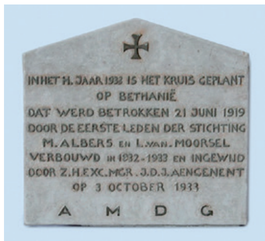
Gedenksteen verbouwing Huize Bethanië

Gedurende de honderd jaar geschiedenis die dit jaar wordt gevierd, is baanbrekend werk verricht in Nederland maar ook daarbuiten. In de buurt van de jezuïeten-parochies te Rotterdam, Den Haag, Leiden, Amsterdam, Utrecht en later Groningen werd een huis opgezet. Buurtwerk werd ontwikkeld in de achterstandswijken van de grote steden. De Vrouwen gaven catechese en geestelijke begeleiding, en er was meer aandacht voor de eigen ontwikkeling en studie. Er kwam een studiehuis in Nijmegen,