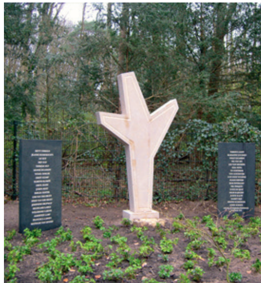
Het grafmonument op de begraafplaats