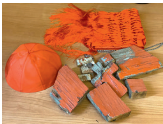
Czerny gebruikte hout van een migrantenboot voor zijn borstkruis.

trum voor mensenrechten. Hij was daarna docent in Nairobi en stichtte het netwerk van de jezuïeten voor de bestrijding van AIDS. In 2010 kwam hij naar Rome en werkte op de afdeling Justitia et Pax in het Vaticaan. In 2016 werd een nieuw dicasterie opgericht in Rome voor de Promotion of Integral Human Development , de bevordering van de integrale ontwikkeling van de mens. Pater Czerny werd er tweede secretaris met bijzondere aandacht voor migranten en vluchtelingen. In Rome wist men wel dat pater Franciscus pater Czerny dikwijls om advies vraagt, en dat ze elkaar regelmatig zien over de situatie van vluchtelingen en migranten. Maar dat de tweede secretaris nu opeens kardinaal is gecreëerd kwam als een grote verrassing, en gooit de normale gezagsverhoudingen binnen de organisatie flink in de war. De paus gaf hem een sleutelrol binnen de synode over de jeugd vorig jaar, en recent in de synode over het Amazonegebied.