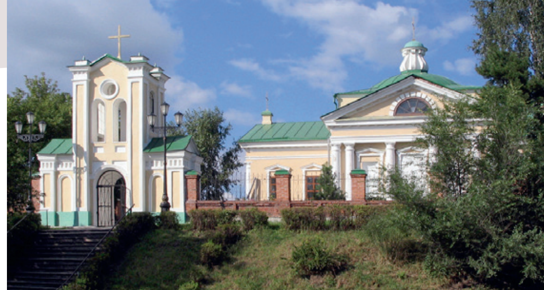
De parochiekerk van Tomsk, in West-Siberië.

Tot slot is er een gemeenschap van mensen met een handicap, zoals 'L'Arche', geleid door katholieken en orthodoxen.