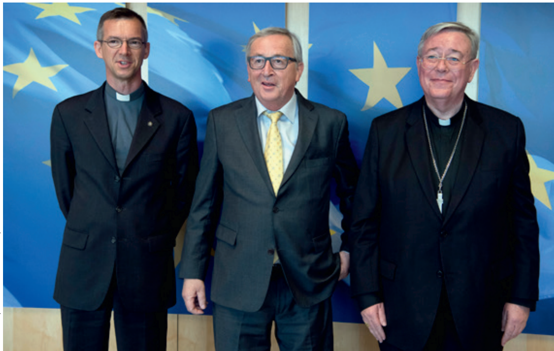
Mgr. Jean-Claude Hollerich in gezelschap van zijn landgenoot Jean-Claude Juncker, president van de Europese Commissie.

Pater Hollerich is jezuïet van de Japanse provincie en een echte wereldburger. Voordat deze Luxemburger intrad in de Orde studeerde hij theologie in Rome. In 1981 trad hij in op de leeftijd van 23 jaar. In 1985 ging hij voor de eerste keer naar Japan. Hij leerde er de taal en de cultuur kennen. Hij haalde een graad in de theologie in Frankfurt en in taalwetenschappen in Bonn. In Japan doceerde hij Frans en Duits en was bestuurder van de Sophia Universiteit in Tokyo. Ieder jaar gaat hij met Japanse studenten naar projecten van de jezuiten in het noorden van Thailand. In 2011 werd hij aartsbisschop in zijn geboorteland. In de jaren erna werd zijn talent voor