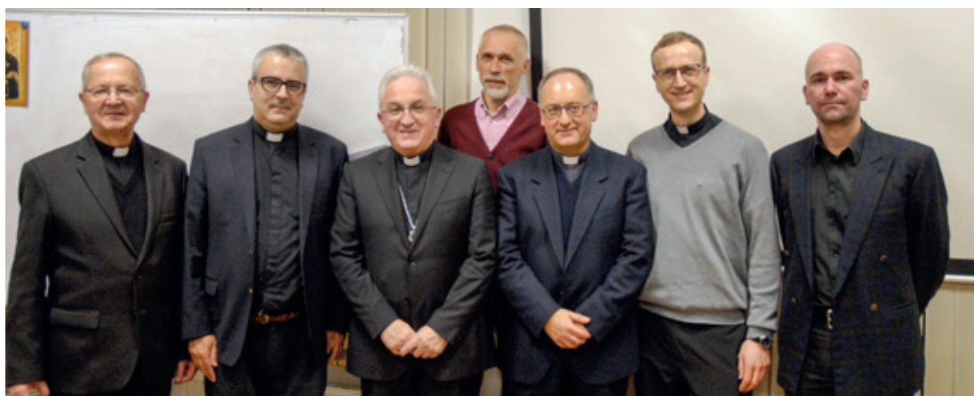
De jezuïeten van de communiteit in Moskou met in het midden de Apostolische Nuntius en Antonio Spadaro SJ

Tomsk verdient speciale vermelding. De parochie werd in 1812 door de jezuïeten gesticht. De kerk dateert uit deze periode. Een onderwijsinstelling, van kleuterschool tot middelbare school, is door het bisdom aan de Sociëteit toevertrouwd. Op dit moment telt ze 144 leerlingen/studenten, orthodoxe, katholieke of pinksterstudenten (zeer talrijk in de regio). Bovendien komt de pastorale activiteit van de vijf aanwezige jezuïeten ten goede aan soms landelijke gemeenschappen, bestaande uit voormalige gedeporteerden of hun nakomelingen.