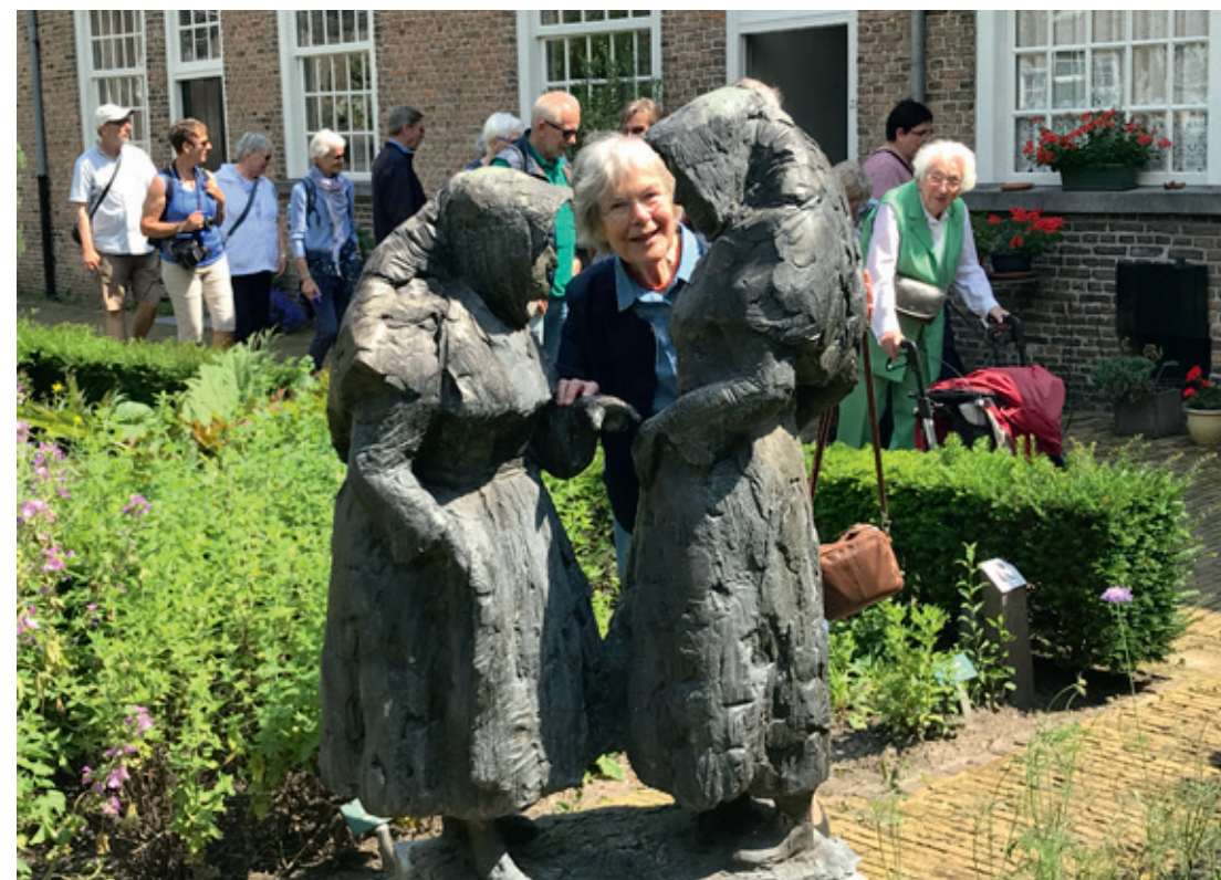
Begijnhof in Breda

Er werd hard gewerkt. En er werd eerlijk gezocht naar wat de oorspronkelijke visie moest betekenen voor leven én werken. Dit leidde ertoe dat de Vrouwen - jaren voor het Tweede Vaticaans Concilie uit - terugkeerden naar het charisma van de oorspron-