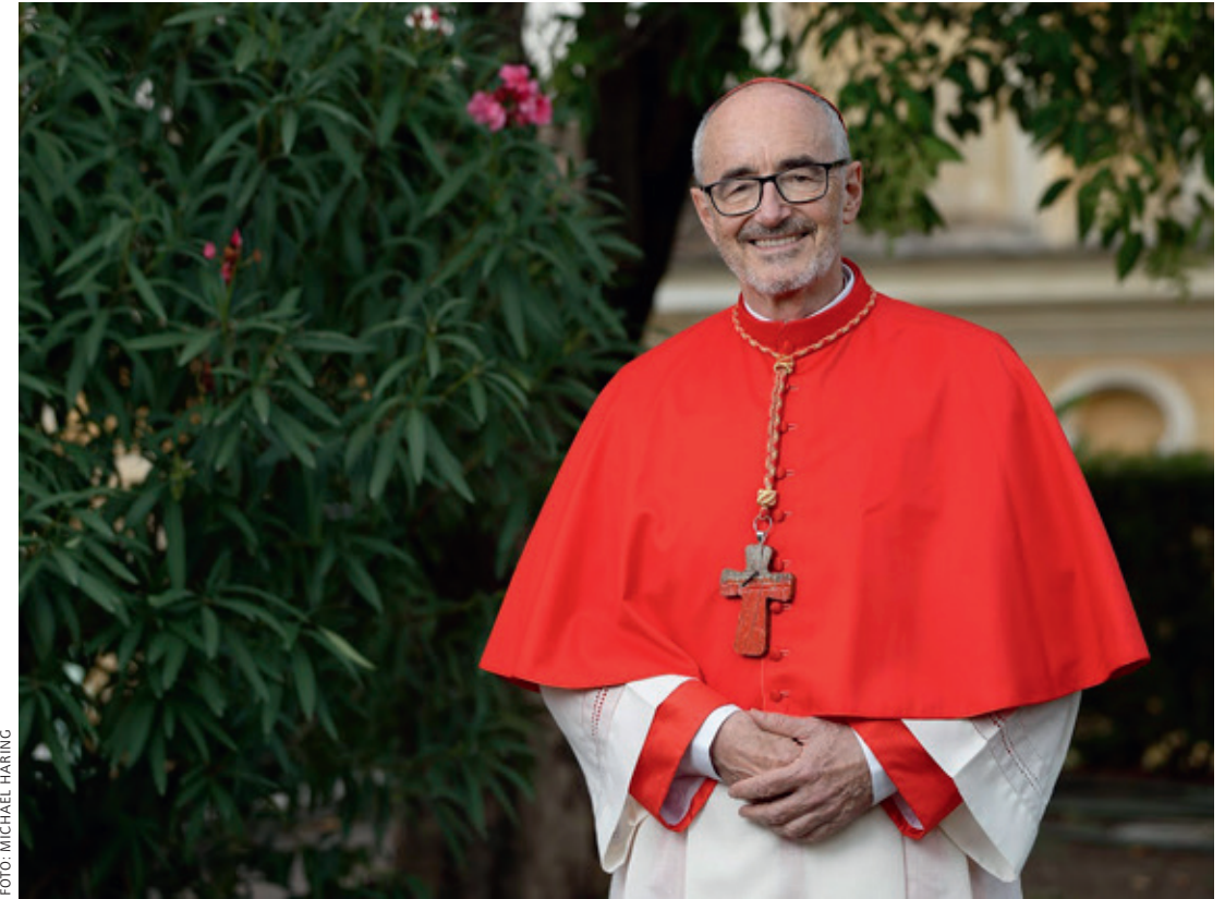
Mgr. Michael Czerny SJ

besturen ontdekt door zijn collega's bisschoppen. Hollerich kreeg verschillende functies op Europees niveau onder andere bij Justitia et Pax , de katholieke organisatie voor gerechtigheid en vrede. In maart 2018 werd hij gekozen tot voorzitter van het overleg van de conferenties van bisschoppen in de Europese Unie. Deze groep COMECE houdt kantoor in Brussel en is een vaste gesprekspartner van de Europese Commissie.