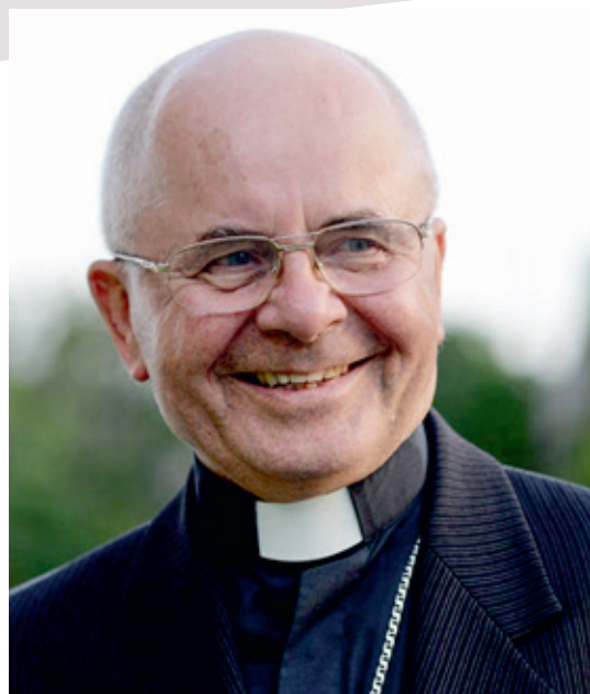
Mgr. Sigitas Tamkevičius SJ

Sigitas Tamkevičius SJ is nu 81 jaar en daarmee te oud om nog aan een conclaaf deel te nemen waarin de volgende paus wordt gekozen. Zijn benoe-