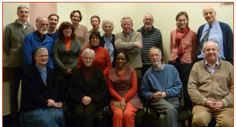
Ons team van vriendschappelijke en geaccrediteerde bezoekers in Vogelzang.